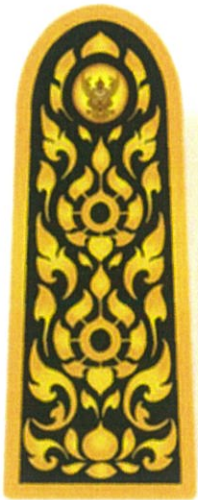
แสดงภาพตัดขวางอินทราฐมีความโค้ง

รูปแบบ อินทราฐมีลักษณะเป็นรูปสี่เหลี่ยมผืนผ้าแนวตั้งปลายด้านบนมนโค้งมีกระดุมครุฑ สีทองประดับอยู่ด้านบนมีรูปลายไทยประกอบเต็มพื้นที่