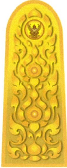
อินทราฐผู้อำนวยการและ ผู้ปฏิบัติงานในตำแหน่งบริหารระดับสูง