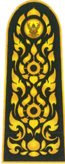
อินทราฐผู้ปฏิบัติงาน ในตำแหน่งผู้บริหารระดับกลาง