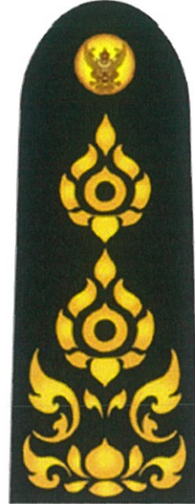
อินทราฐผู้ปฏิบัติงาน ในตำแหน่งอื่น