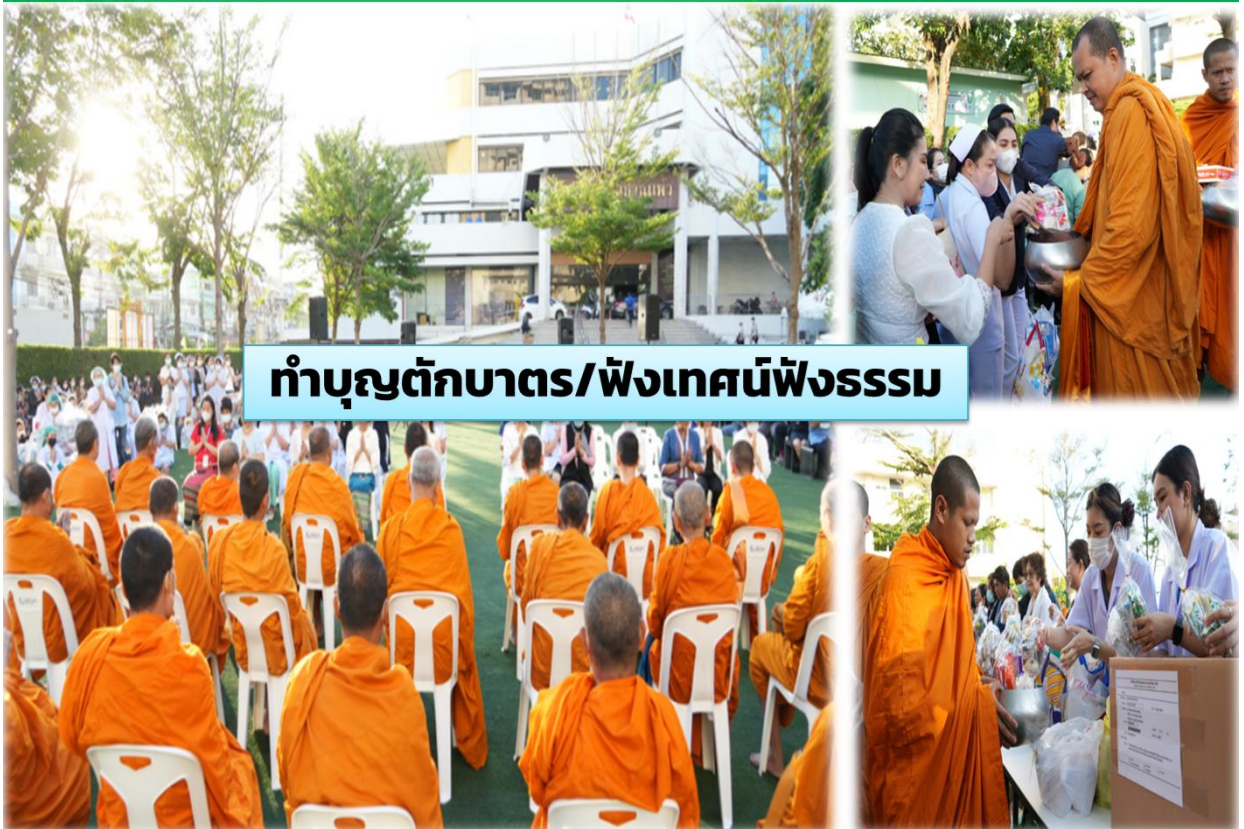
ทำบุญตักบาตร/ฟังเทศน์ฟังธรรม