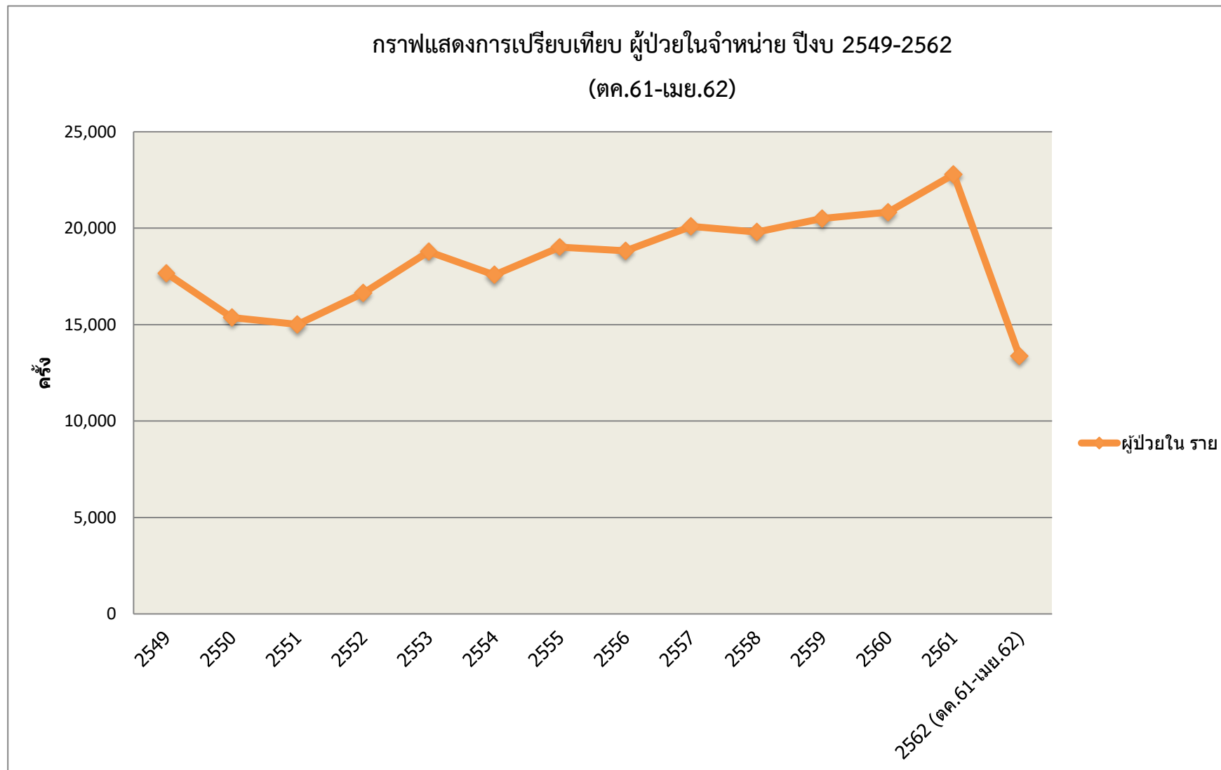
กราฟแสดงการเปรียบเทียบ ผู้ป่วยในจำหน่าย ปีงบประมาณ 2549-2562 (ตค.61-เมย.62)